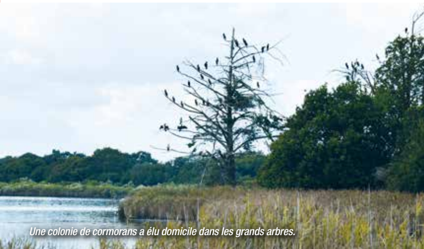
Une colonie de cormorans a élu domicile dans les grands arbres.

Le site doit son existence à la présence de deux digues à la mer construites au XIX e siècle. Des aménagements artificiels permettent de réguler les entrées et les sorties d'eau. La volonté de renforcer la naturalité du site pourra avoir une incidence sur la gestion hydraulique de l'étang (notamment fermeture/ouverture des vannes). Pour affiner la gestion, une étude hydraulique sera réalisée. Grâce à un diagnostic des ouvrages, elle permettra de prévoir les suivis à mener ainsi que les travaux ou améliorations à apporter pour consolider les digues et restaurer vannes et batardeaux. La gestion du niveau d'eau sur la pièce principale sera étudiée de manière à favoriser la diversité végétale et animale.