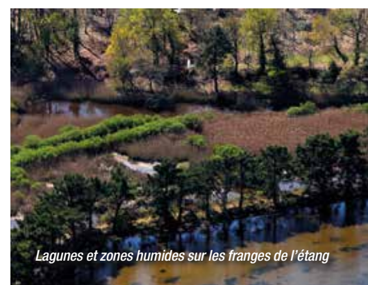
Lagunes et zones humides sur les franges de l'étang