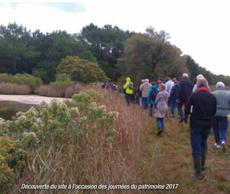
Découverte du site à l'occasion des journées du patrimoine 2017

Deux constructions - la ferme et le séchoir à chicorée - ont été érigées sur le site dans la première moitié du XX e siècle. Dans une optique de conservation et de valorisation du patrimoine bâti, une étude d'aménagement a été confiée à l'École Boulle (école d'arts appliqués, de l'architecture intérieure et du design). La possibilité d'y créer un point d'accueil des visiteurs est envisagée.