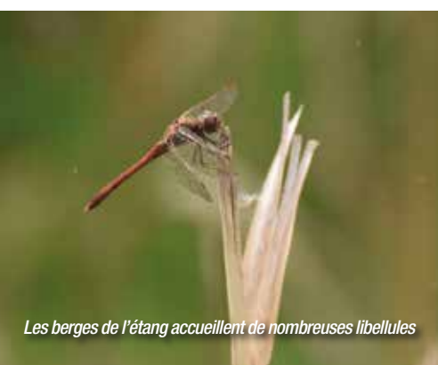
Les berges de l'étang accueillent de nombreuses libellules

Le ragondin est l'espèce qui produit le plus de dommages : il attaque le bois des batardeaux et fragilise la structure des digues. Le contrôle des populations de sangliers et de chevreuils sera poursuivi.