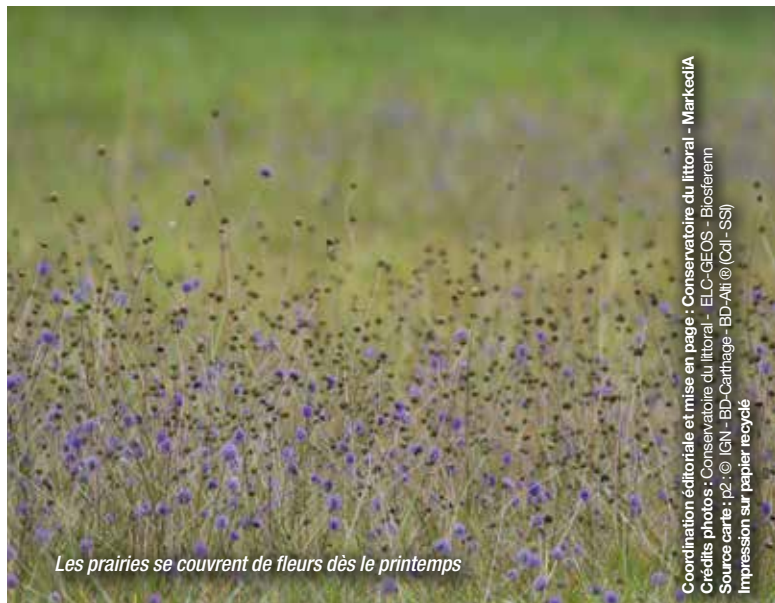
Les prairies se couvrent de fleurs dès le printemps

Coordination éditoriale et mise en page : Conservatoire du littoral - Markecia Impression sur papier recyclé