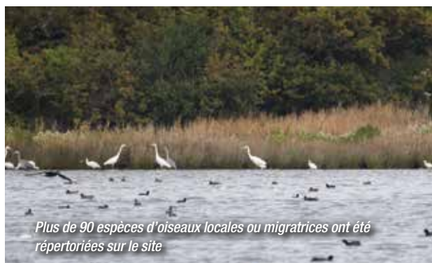
Plus de 90 espèces d'oiseaux locales ou migratrices ont été répertoriées sur le site

S'il présente aujourd'hui les caractéristiques d'une nature préservée, la configuration actuelle du site est le résultat d'une dynamique à la fois naturelle et humaine. En effet, la construction de la digue principale sur le chenal de Saint-Jean en 1866 s'est accompagnée de la mise en place d'ouvrages de gestion hydraulique et d'aménagements régulant les entrées et sorties d'eau marine. Dans les années 1970, de grands travaux de création de pièces d'eau annexes ont également profondément transformé le site.