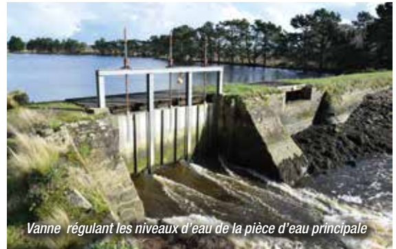
Vanne régulant les niveaux d'eau de la pièce d'eau principale

Le plan de gestion fixe comme priorité de conserver et améliorer le caractère naturel de cette zone humide en interaction dynamique avec la mer. Il veille notamment à préserver la mosaïque d'habitats - lagunes côtières, prés salés et roselières. Les orientations retenues favorisent une importante diversité végétale qui participe à attirer un grand nombre d'espèces d'oiseaux, conférant ainsi au site un intérêt ornithologique majeur.